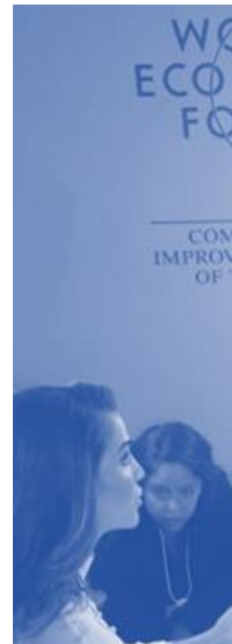
решение практических задач